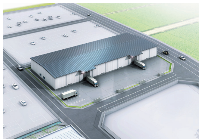
※2024年2月時点 完成イメージ