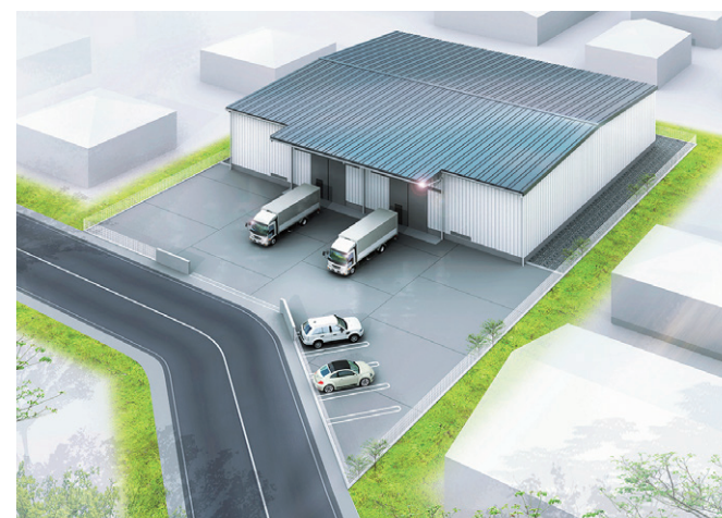
※2024年3月時点 完成イメージ