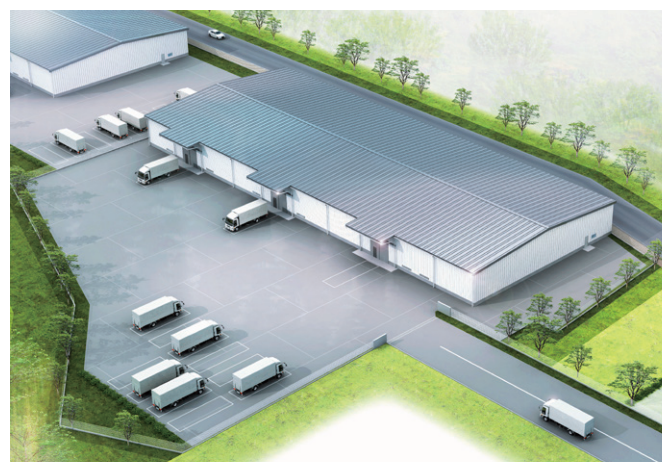
※2024年1月時点 完成イメージ