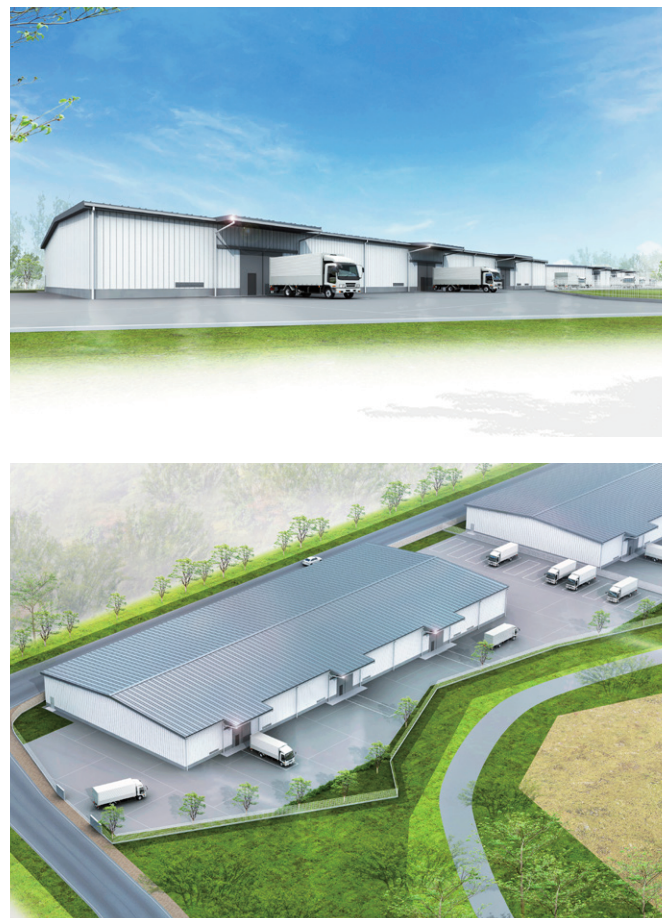
※2024年1月時点 完成イメージ

新門司港まで車約2分 新門司物流団地まで約500m 太刀浦・田ノ浦コンテナターミナル約7km 北九州空港まで約20km