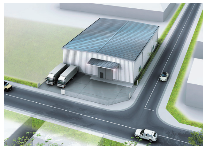
※2023年12月時点 完成イメージ