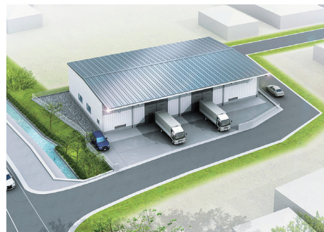
※2023年11月時点 完成イメージ