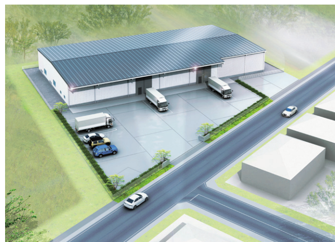
※2023年11月時点 完成イメージ