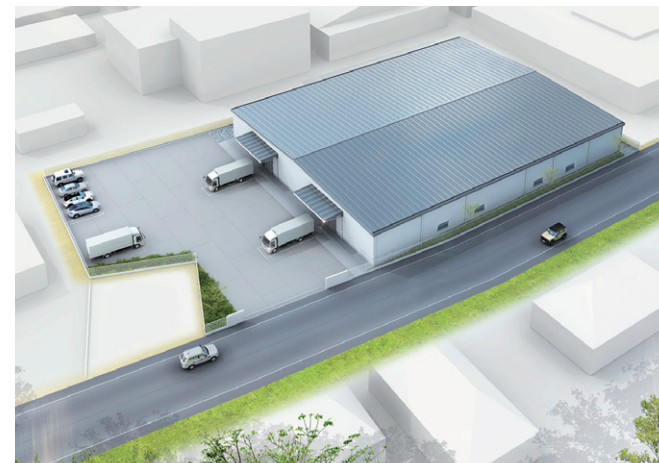
※2023年8月時点 完成イメージ