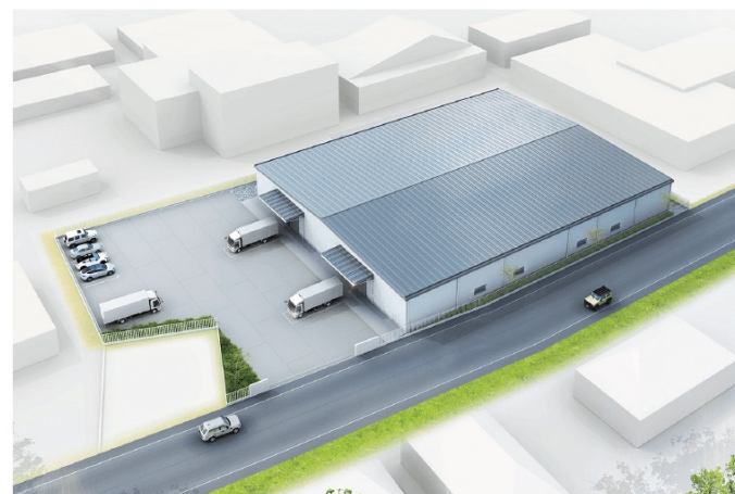
※2023年9月時点 完成イメージ