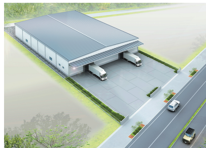
※2023年8月時点 完成イメージ

圏央道「阿見東」ICより、わずか約1kmと至近。常磐自動車道や東北自動車道も乗り入れやすく、高速道路網を自在に活用できる物流拠点として利便性高く最適な立地。 2024年8月竣工予定